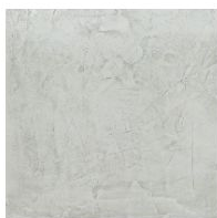
Цемент Travertin look

Materials, fabrics, leathers, colors and finishes are approximate and may slightly differ from actual ones. You can find the complete collection of Bonaldo fabrics and leathers on the website