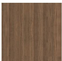
Шпонированное дерево Черный орех