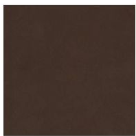
Крашенный металл Матовый бронзовый