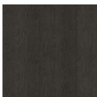
Шпонированное дерево Дуб брашированный цвета угля