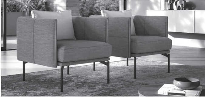
POLTRONA E DIVANETTO / ARMCHAIR AND SMALL SOFA