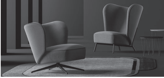
ROMEO POLTRONA / ARMCHAIR