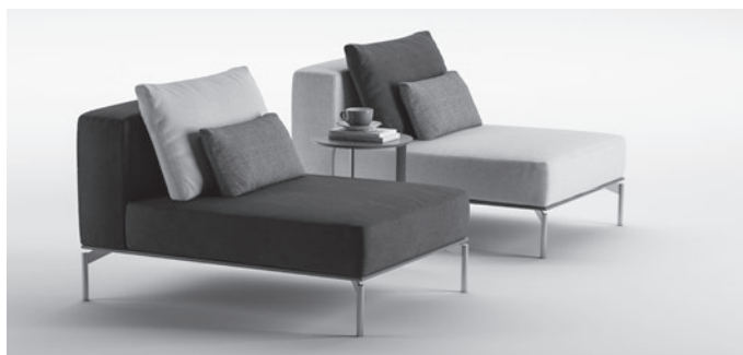
CHAISE LONGUE / CHAISE LONGUE