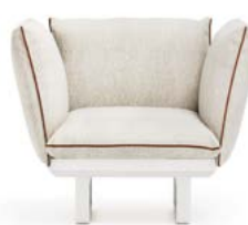
N.1 STRUCTURE MODULE 1P N.1 SEAT CUSHION 1P N.3 BACKREST CUSHION WITH INTERNAL SUPPORT