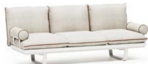
DIVANO CON CUSCINI CILINDRO BRACCIOLO SOFA ROLLER CUSHION N.1 STRUCTURE MODULE 3P N.1 SEAT CUSHION 2P N.3 BACKREST CUSHION WITH INTERNAL SUPPORT N.2 ROLLER CUSHION WITH INTERNAL SUPPORT