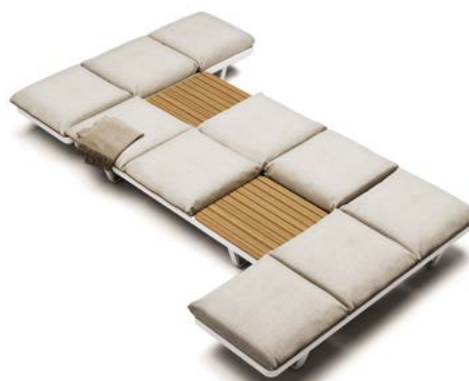
4 STRUCTURE MODULE 3P 2 SEAT CUSHION 3P 2 SEAT CUSHION 2P 2 TOP IN TEAK