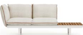
N.1 STRUCTURE MODULE 3P N.1 SEAT CUSHION 2P N.3 BACKREST CUSHION WITH INTERNAL SUPPORT N.1 TEAK TOP