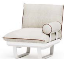
N.1 STRUCTURE MODULE 1P N.1 SEAT CUSHION 1P N.1 BACKREST CUSHION WITH INTERNAL SUPPORT N.1 ROLLER CUSHION WITH INTERNAL SUPPORT