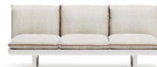
DIVANO CENTRALE | CENTRAL SOFA N.1 STRUCTURE MODULE 3P N.1 SEAT CUSHION 3P N.3 BACKREST CUSHION WITH INTERNAL SUPPORT