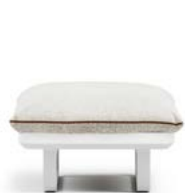
N.1 STRUCTURE MODULE 1P N.1 SEAT CUSHION 1P