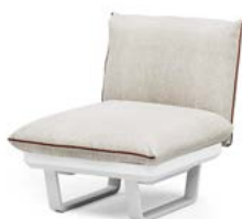
N.1 STRUCTURE MODULE 1P N.1 SEAT CUSHION 1P N.1 BACKREST CUSHION WITH INTERNAL SUPPORT