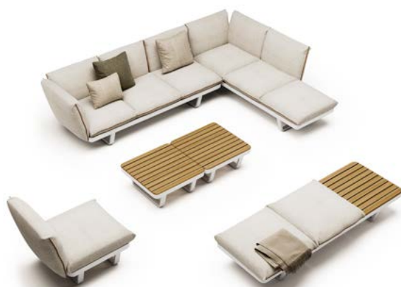
3 STRUCTURE MODULE 1P 3 STRUCTURE MODULE 3P 3 TOP TEAK 2 SEAT CUSHION 3P 8 BACKREST CUSHION WITH INTERNAL SUPPORT 1 SEAT CUSHION 1P