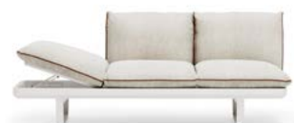
N.1 STRUCTURE MODULE 3P N.1 SEAT CUSHION 3P N.2 BACKREST CUSHION WITH INTERNAL SUPPORT