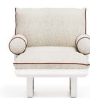
N.1 STRUCTURE MODULE 1P N.1 SEAT CUSHION 1P N.1 BACKREST CUSHION WITH INTERNAL SUPPORT N.2 ROLLER CUSHION WITH INTERNAL SUPPORT