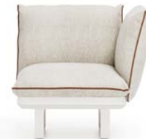
N.1 STRUCTURE MODULE 1P N.1 SEAT CUSHION 1P N.2 BACKREST CUSHION WITH INTERNAL SUPPORT