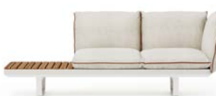
N.1 STRUCTURE MODULE 3P N.1 SEAT CUSHION 2P N.3 BACKREST CUSHION WITH INTERNAL SUPPORT N.1 TEAK TOP

3 STRUCTURE MODULE 1P 3 STRUCTURE MODULE 3P 3 TOP TEAK 2 SEAT CUSHION 3P 8 BACKREST CUSHION WITH INTERNAL SUPPORT 1 SEAT CUSHION 1P