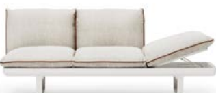
N.1 STRUCTURE MODULE 3P N.1 SEAT CUSHION 3P N.2 BACKREST CUSHION WITH INTERNAL SUPPORT