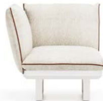
N.1 STRUCTURE MODULE 1P N.1 SEAT CUSHION 1P N.2 BACKREST CUSHION WITH INTERNAL SUPPORT