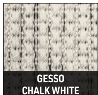
GESSO CHALK WHITE

Pour la réalisation de tapis sur mesure, prière de fournir un dessin au format DWG, comprenant les dimensions détaillées. Le fichier sera vérifié par le Bureau technique qui se réserve le droit d'approuver ou de demander des modifications du dessin avant de procéder à la fabrication du tapis.