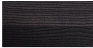
WOOD Burnished and hand-brushed ash Col. Dark Olive

Printed colors are to be considered as purely indicative.