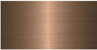
METAL FINISH Bronze Shadow matt

I colori stampati sono da considerarsi puramente indicativi.