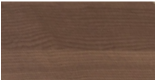
WOOD Burnished and hand-brushed ash Col. Light Olive