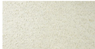
SPECIAL MATERIALS Reconstituted Travertine Col. Ivory