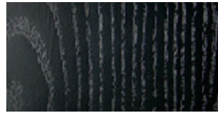
WOOD Black stained Ash

Printed colors are to be considered as purely indicative. For upholstery, refer to the Sample Chart .