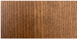
WOOD Walnut stained Ash

I colori stampati sono da considerarsi puramente indicativi. Per i rivestimenti, fare riferimento alla Sample Chart .