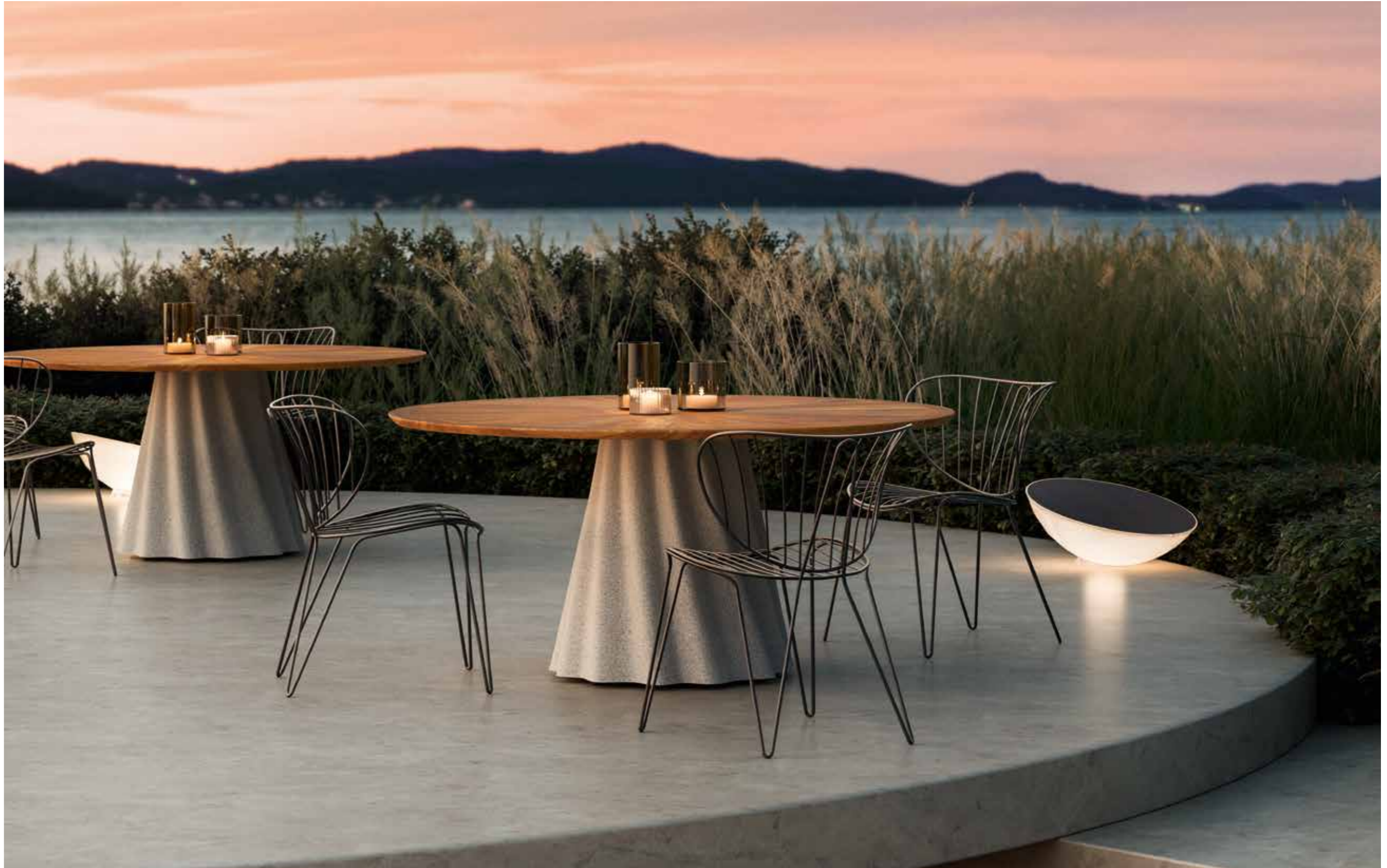
Onda tavolo outdoor. Piano legno Iroko, base 61 Cemento. / Onda outdoor table. Top in Iroko wood, base in finish 61 Cemento.