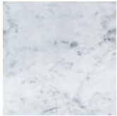
Bianco Carrara White Carrara