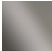
Black nichel Black nickel