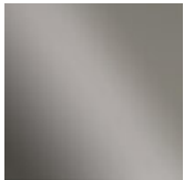
Black nichel Black nickel