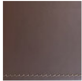
Testa di moro Dark brown