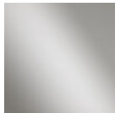
Cromo lucido Glossy chrome