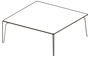
T96 90X90XH.35 / 35X35XH.14"