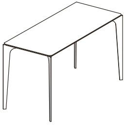
T95 90X40XH.45 / 35X16XH.18"